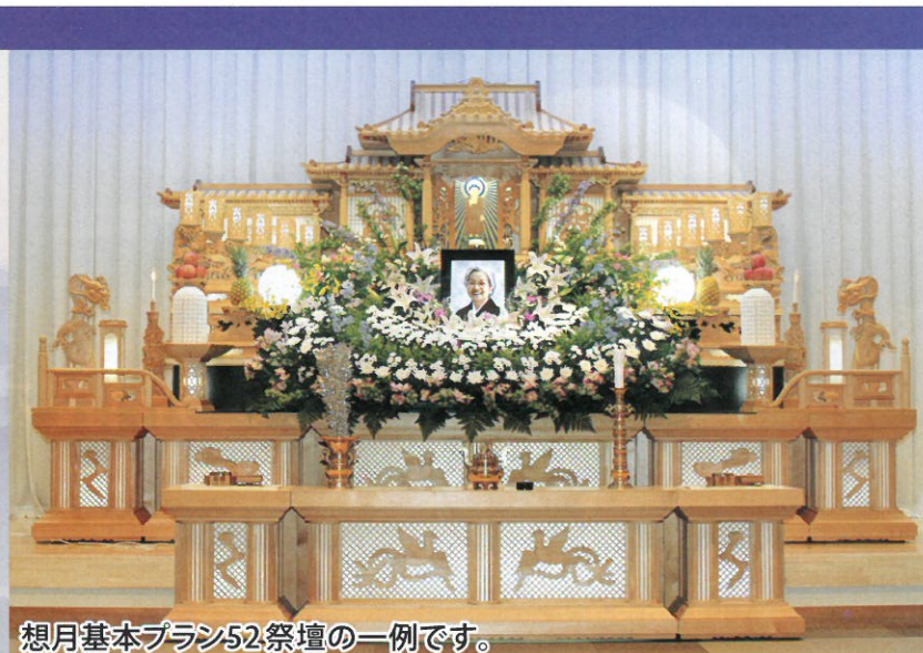
想月基本プラン52祭壇の一例です。