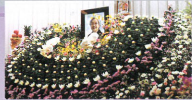
※祭壇セット、お食事、貸衣装は除く

ご満足いただける充実のプランをご用意。[オプションもあります。] その他ご要望等ございましたらご相談に応じさせていただきます。